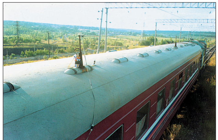
Рис. 1 Компьютеризированный вагон-лаборатория КВЛ-П1МП

Технология производства работ по оценке состояния рельсовой колеи выглядит следующим образом: компьютеризированный вагон-лаборатория КВЛ-П1МП движется по железнодорожному пути и производит сбор данных диагностики в память бортового компьютера в штатном режиме. Параллельно с этим в режиме реального времени работает спутниковый навигационно-геодезический